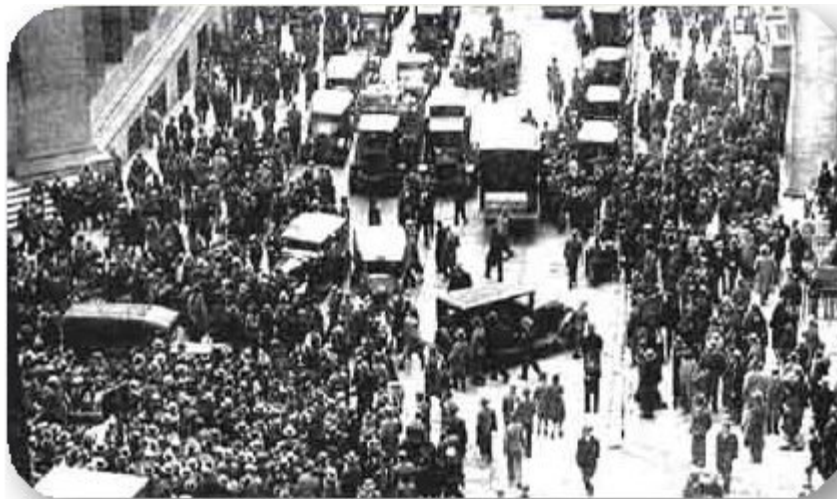
BO: Wall Street (die New Yorkse effektebeurs) op 24 Oktober 1929. Die sogenaamde “Swart Donderdag”

In die volgende vyf dae het die mark skrikwekkend tot stilstand geknars en 'n wêreldwye ekonomiese ineenstorting veroorsaak, wat vandag beskou word as die langste en ernstigste tydperk van werkloosheid, stagnasie in die sakewêreld en armoede in die moderne tyd.